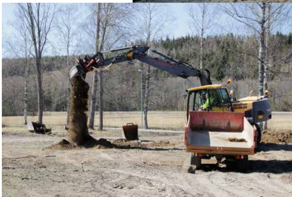
Till vänster: Vissa arbetsuppgifter krävde insatser av externa entreprenörer.