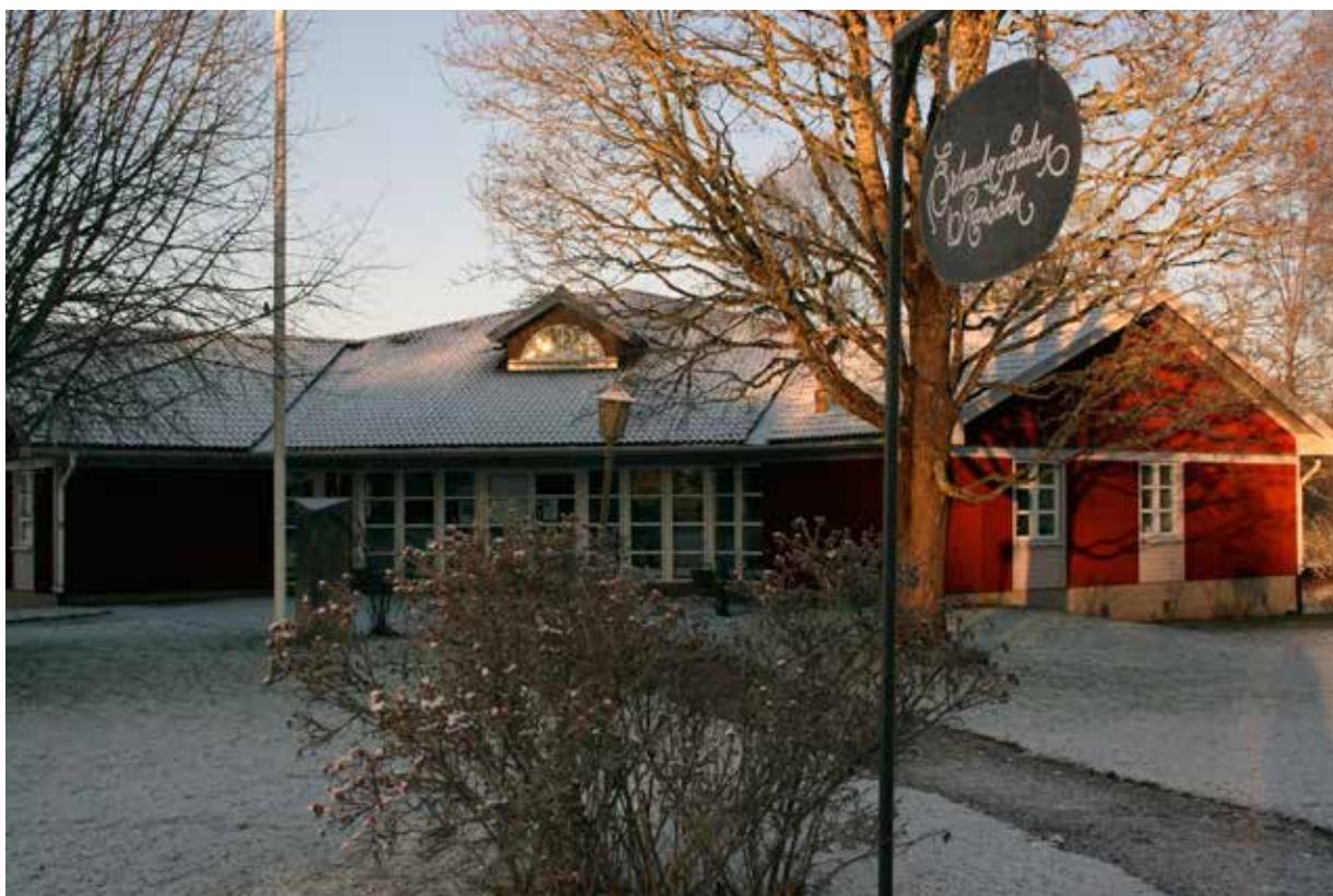
Geijerskolan växer. Musikundervisning bedrivs även i närliggande Erlandergården.