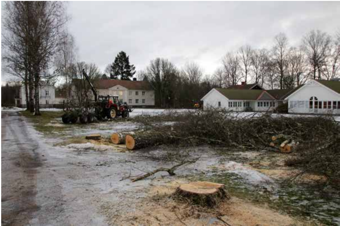
Gamla björkar tas ner utanför musikkorridoren.