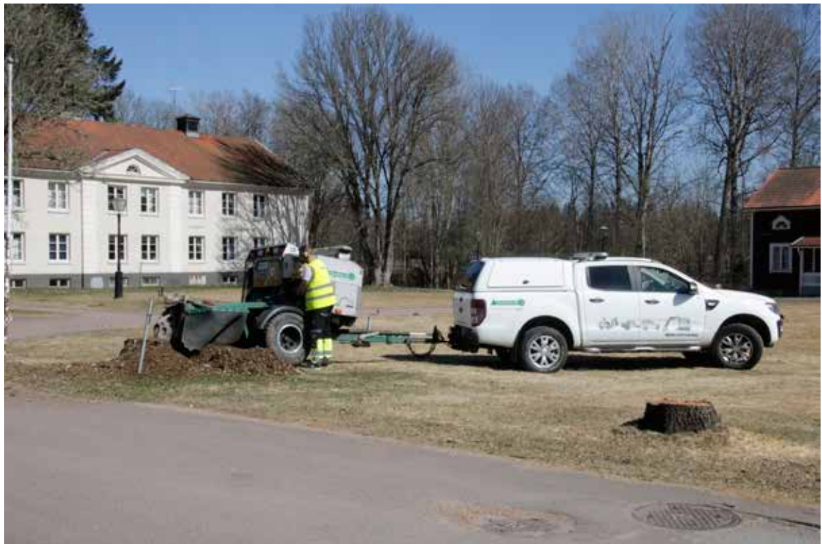
Stubbfräsning pågår. Ny allé med rännar planeras till hösten.