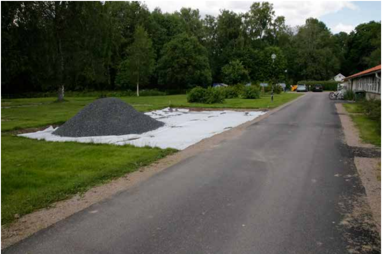
Stationär uteplats vid matsalen iordningställs.